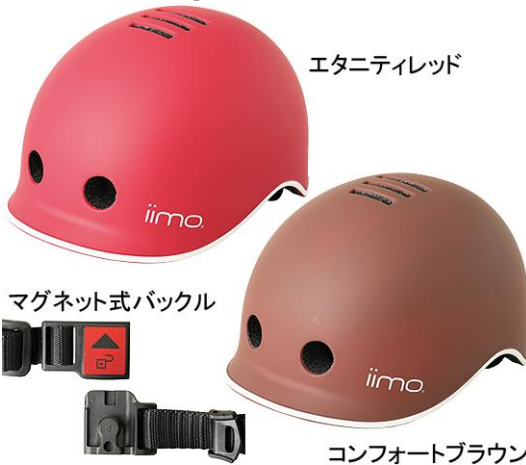
エタニティレッド