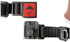
マグネット式バックル