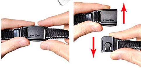
マグネットバックル